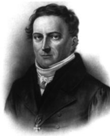
JOHANN FRIEDRICH HERBART